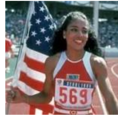
Florence Griffith Joyner