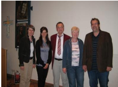
Epilepsie u. Arbeit,