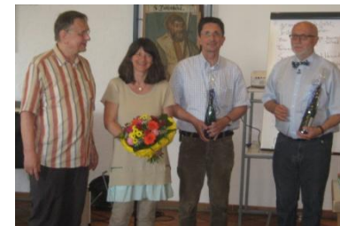
Operative Therapiemöglichkeiten, Dem Leben Vertrauen schenken, auch mit Epilepsie