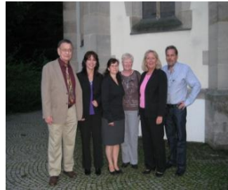
Epilepsie-Schwangerschaft u. Kinderwunsch