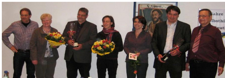
Epilepsie , warum ist sie so unheimlich? Therapiemöglichkeiten? Unwägbarkeiten und Neuigkeiten vom heutigen Stand der Epileptologie. Leben mit Epilepsie, wie oute ich mich?